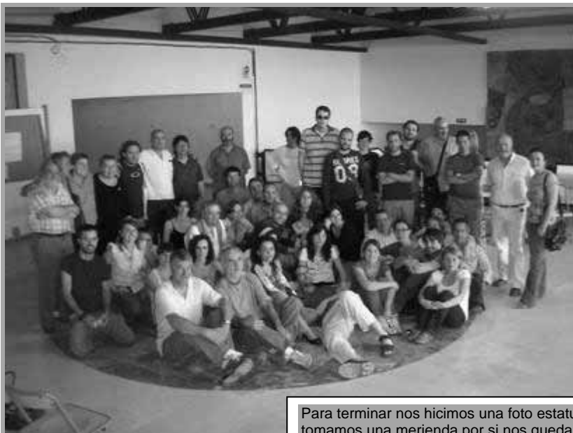
Para terminar nos hicimos una foto estatua y aún nos tomamos una merienda por si nos quedaron cosas por compartir

Se paso a un pequeño debate del grupo completo y se acordó la configuración de un grupo motor que pudiera seguir impulsando la coordinadora